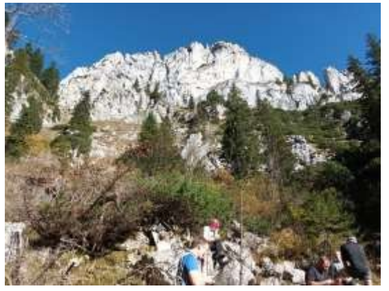
Wanderung zum Marterl auf die Kampenwand