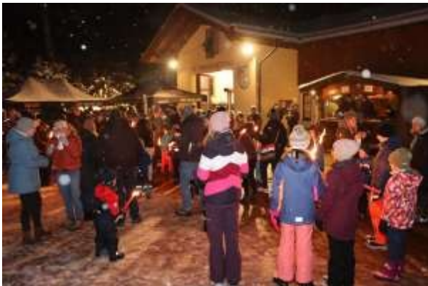
Wintersonnwendfeier mit Fackelwanderung