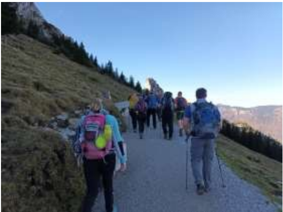
Wanderung zum Marterl auf die Kampenwand